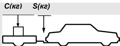
верное размещение груза