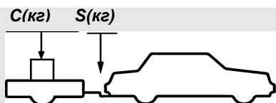
верное размещение груза