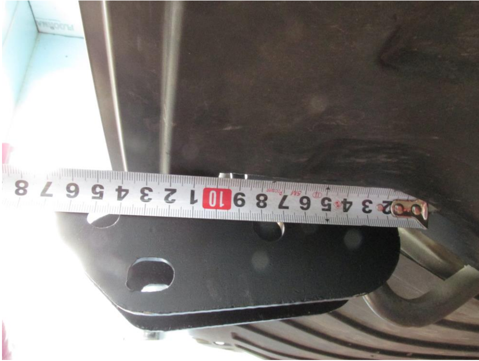
ТСУ 7611. Рис.2. Вырез в защите бампера.